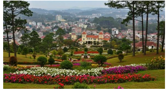
고원 리조트 달랏(Da Lat) 거리

해마다 지구 온난화의 영향으로 벚꽃의 개화가 점점 빨라지고 있습니다. 이 마그나스 뉴스를 받으실 즈음에는 일본의 벚꽃도 이미 절정을 지나가고 있을것입니다. 하지만 추운 북쪽 지방은 이제부터가 시작입니다.